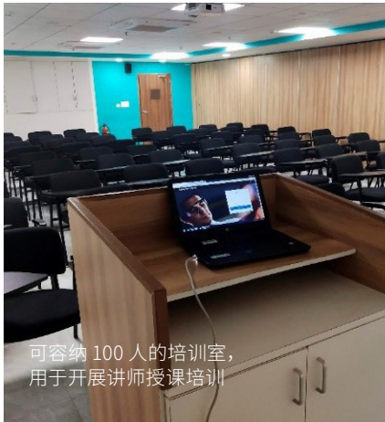
可容纳 100 人的培训室, 用于开展讲师授课培训